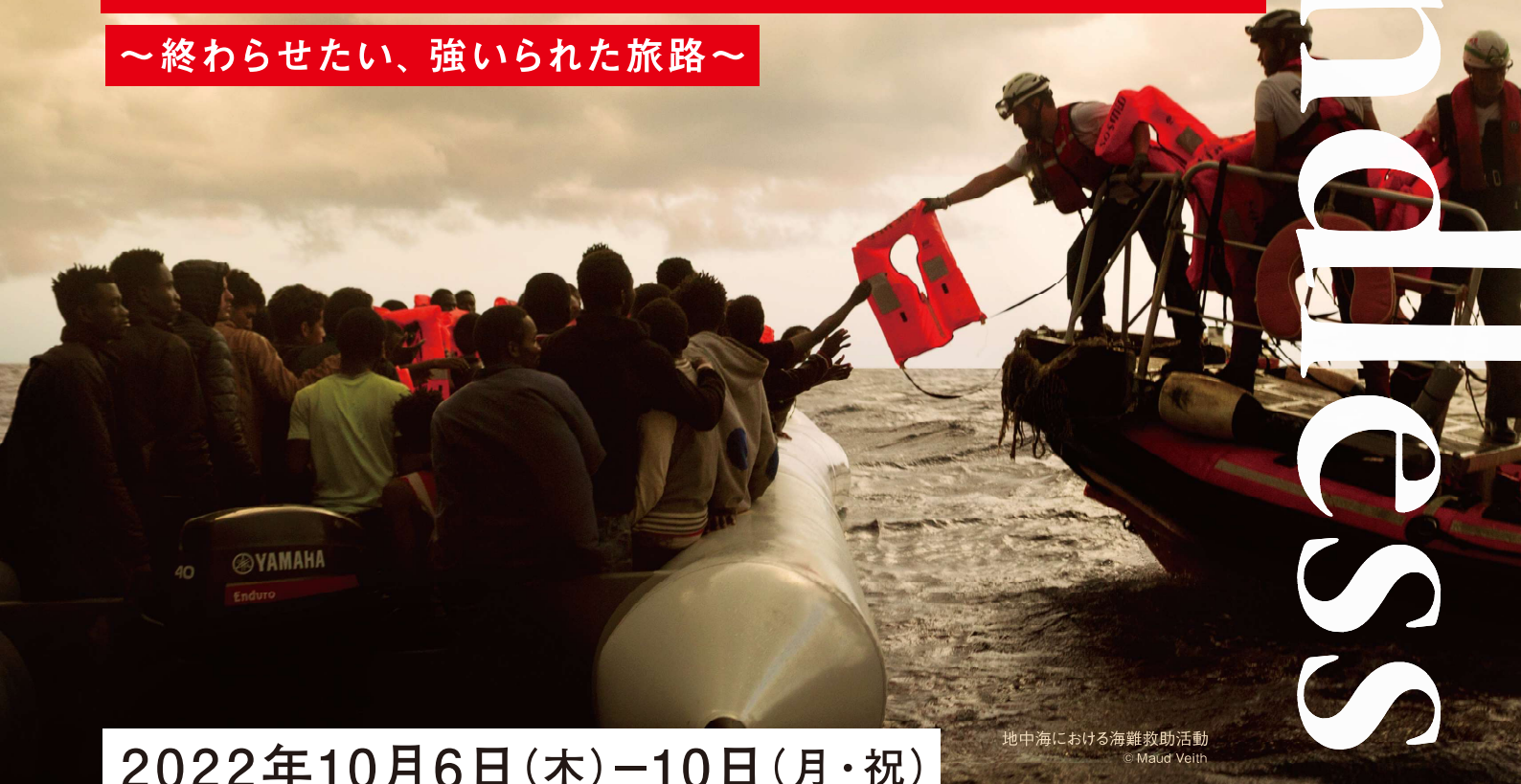
地中海における海難救助活動