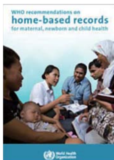
図1 母子の家庭用記録に関するガイドライン(WHO)